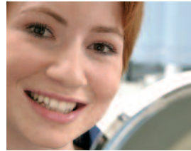
Gesunde und saubere Zähne nach der professionellen Zahnreinigung

Zur Spezialreinigung werden entweder Schall-, Ultraschallgeräte und/oder manuelle Instrumente wie Küretten und Scaler eingesetzt. Mit einem Pulverstrahlgerät lassen sich Zahnverfärbungen beseitigen. Für die Politur werden spezielle Polierbürsten, Polierkelche und für die Zahnzwischenräume Polierstreifen und eine feinkörnige Polierpaste verwendet. Das Aufbringen einer Fluoridlösung oder eines Fluoridlacks rundet die professionelle Zahnreinigung ab.